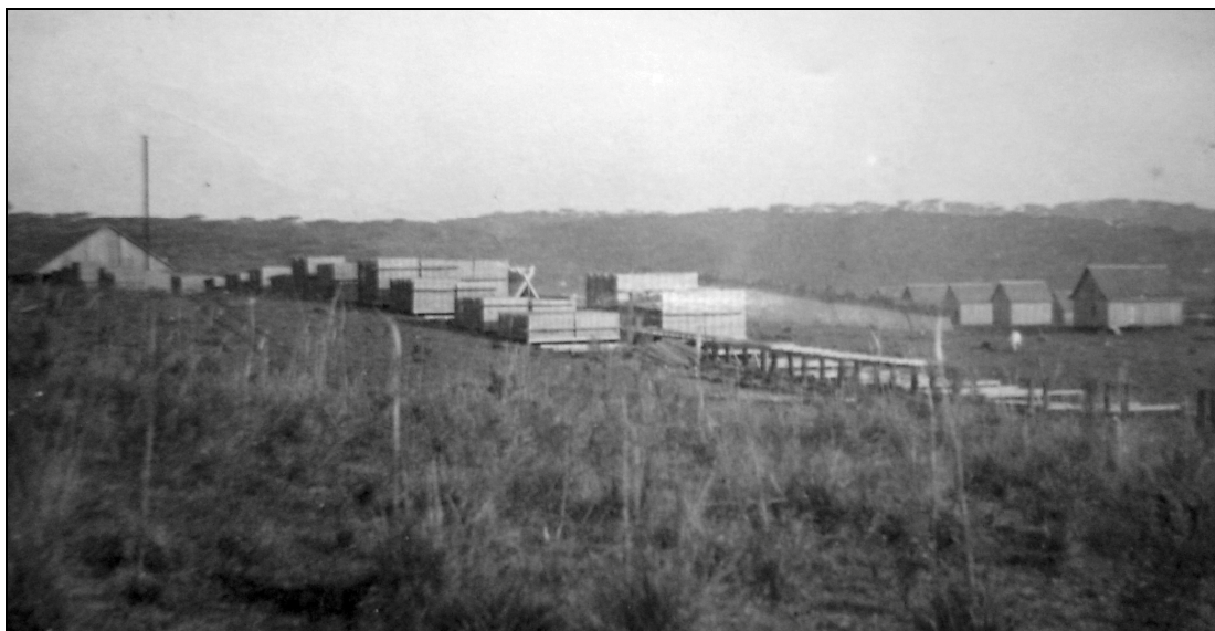
FIGURA 2 – Serraria René Frey & Irmão na década de 1930. Instalada em uma área de campo aberto, antes utilizada na pastagem e no uso em comum por moradores de áreas próximas. Notem ao fundo a floresta de araucárias.

máquinas adquiridas pela empresa. A Figura 2 apresenta os primeiros anos de funcionamento da serraria dos irmãos Frey. Ao fundo é possível observar a mata nativa, até então usufruída em comum.