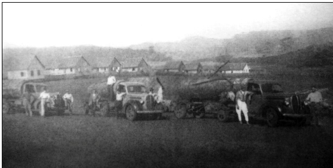
FIGURA 4 – Caminhões adquiridos pela empresa para o transporte de toras para a serraria, transportando apenas uma árvore, serrada em três partes.