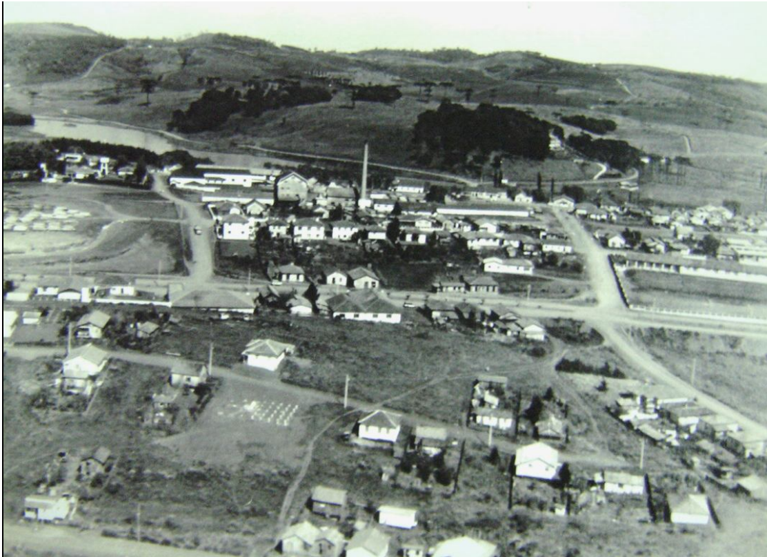
FIGURA 6 – Fraiburgo em meados da década 1960. Ao fundo, a floresta devastada.