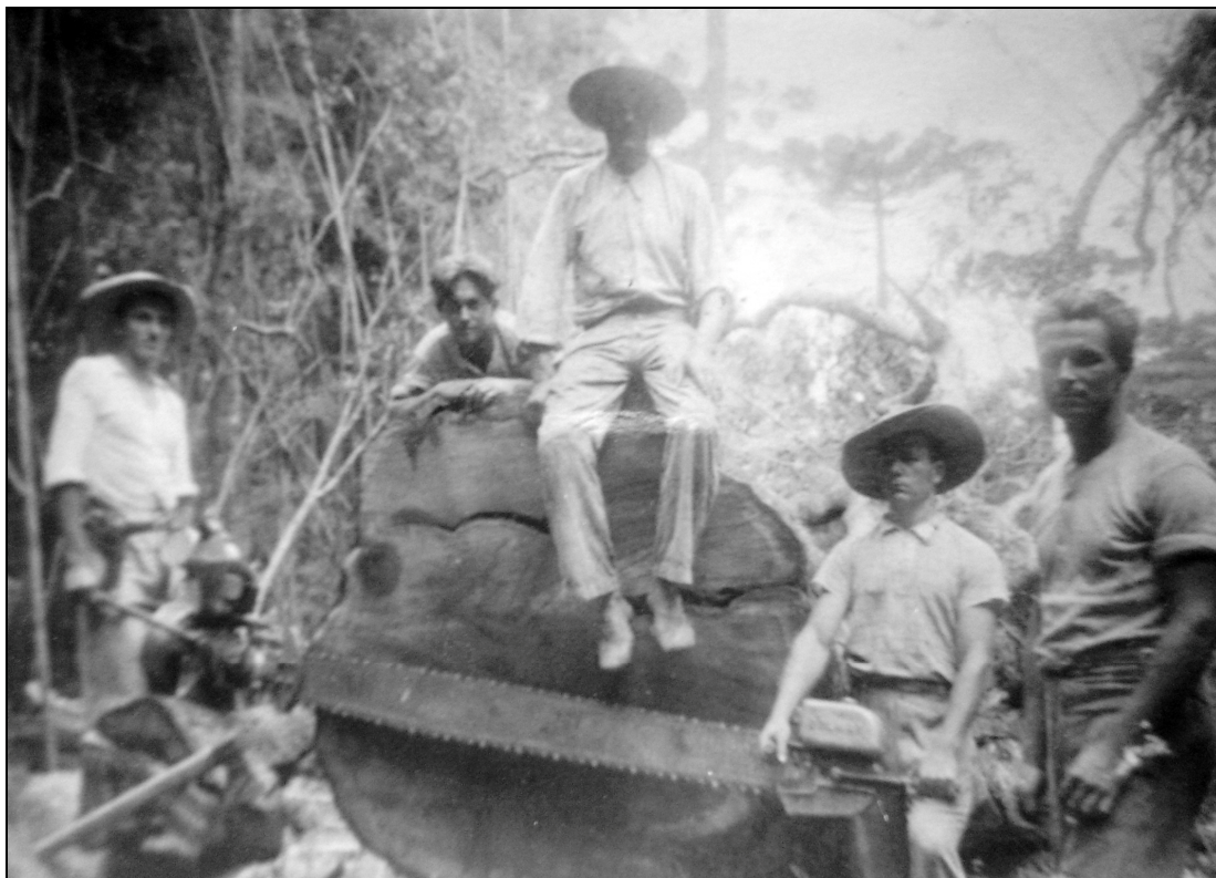
FIGURA 3 – Imbuia centenária derrubada por uma motosserra da serraria René Frey & Irmão no ano de 1946.