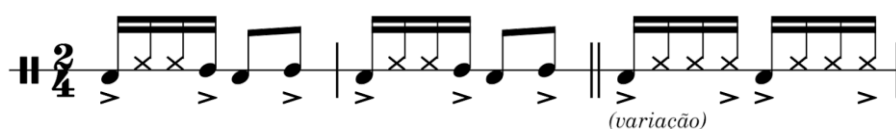
Figura 5 – Clave principal do pandeiro no Boi de Mamão de Santo Antônio

Em termos rítmicos, a clave geral do Boi de Mamão pode ser considerada como uma clave bastante comum, que pode ser encontrada em tradições diversas, não apenas Brasil afora, como mundo afora também, como podemos perceber numa transcrição aproximada do pandeiro do Boi de Santo Antônio 22 (Fig. 5 e Fig. 6).