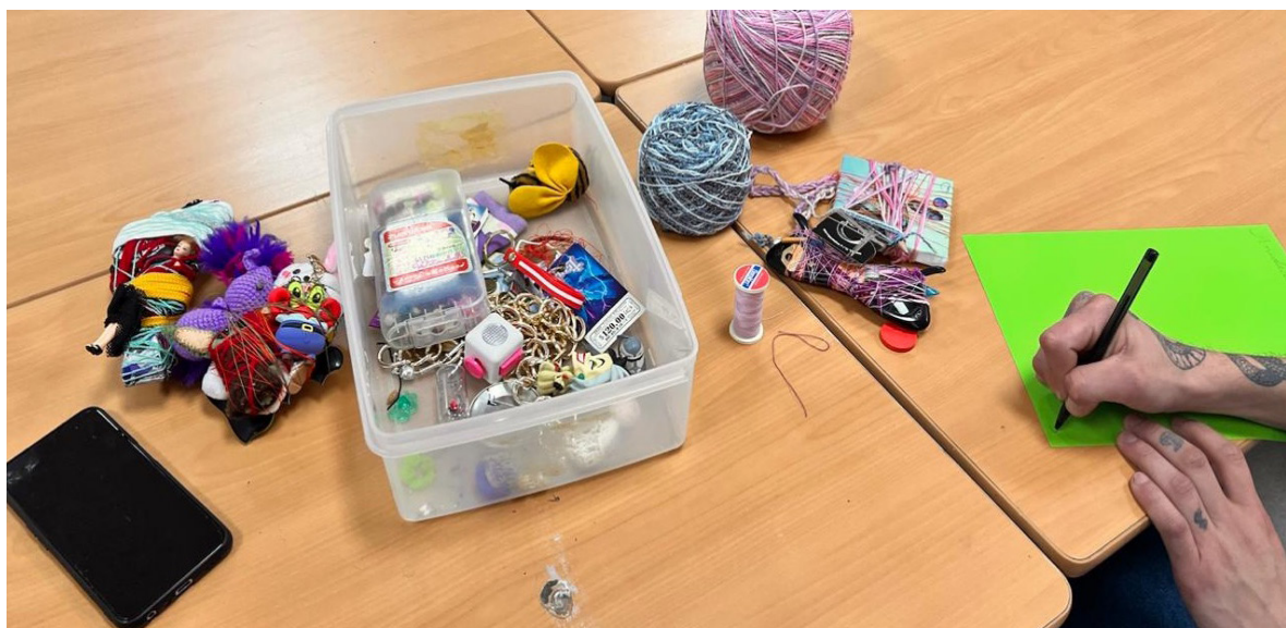
con hilo de coser.

Los dispositivos de aprendizaje consisten en presentar una propuesta, una provocación o una idea general sobre lo que trabajaremos. Desde abordar memorias afectivas, espaciales, sensoriales y colectivas que son convocadas mediante dinámicas grupales en el taller o alguna problemática sociocultural que los y las jóvenes manifiestan durante los encuentros. Algunas de estas dinámicas de trabajo serían: escritura de textos narrativos, producción de imágenes y construcción de un archivo personal de documentación de procesos; el trabajo con fotografías recuperadas; recolección de pequeños objetos, recuerditos y/o artesanías encontradas en el ambiente doméstico, mismas que fueron trabajadas e incorporadas a sus proyectos personales. Consideramos este momento como un ejercicio para “una pequeña arqueología de sí” (imágenes 1 a 5):