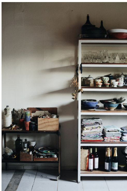
Fig. 7. Casa-ateliê de Celaine Refosco, 2024. Fotografia digital. Pomerode.