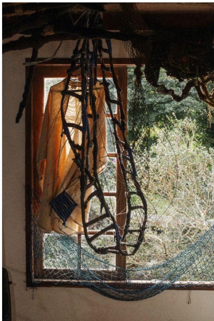
Fig. 5. Do autor. Casa-ateliê de Nara Guichon, 2025. Fonte: do autor. Fotografia digital. Florianópolis.