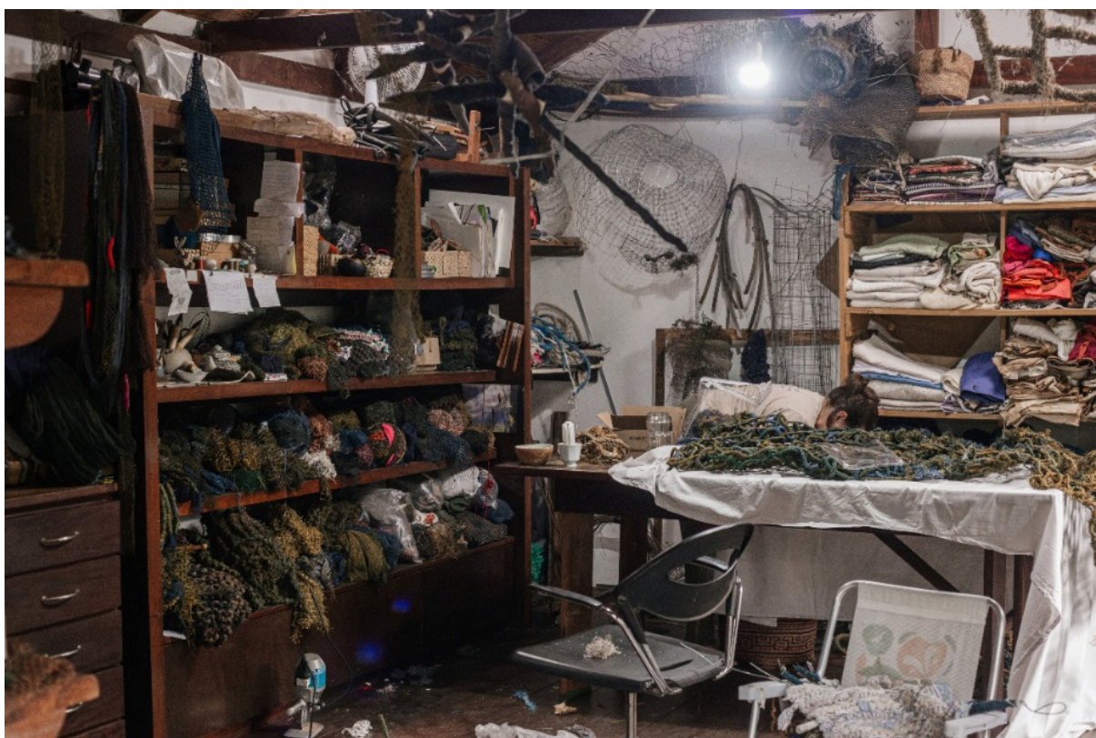
Fig. 4. Do autor. Casa-ateliê de Nara Guichon, 2025. Fonte: do autor. Fotografia digital. Florianópolis.