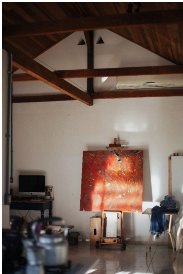
Fig. 8. Do autor. Casa-ateliê de Celaine Refosco, 2024. Fonte: do autor. Fotografia digital. Pomerode.