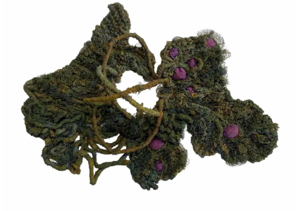
Fig. 2. Nara Guichon. Maris, 2022. Foto: Renata Gordo. Tricô manual, enrolamento de fios, redes de pesca reusadas, tintura de casca de cebolas, seda, 100 x 73 x 30 cm. Florianópolis. Disponível em < https://www.premiopipa.com/nara-guichon/ >, acesso em 14/11/2025.

Além do desejo de compreender como esses mecanismos se manifestam na vida prática do artista, a motivação para escrever este artigo também está relacionada a um interesse genuíno por conhecer as casas por dentro, ouvir suas histórias e registrá-las fotograficamente. Trata-se, portanto, de uma aproximação afetiva com os elementos que compõem minha pesquisa e meus interesses pessoais: o ato de refletir e registrar os lugares da vida íntima – a casa. O ateliê entra como interesse por eu também ser artista, desse modo, é um espaço que carrego comigo pelas casas que habito.