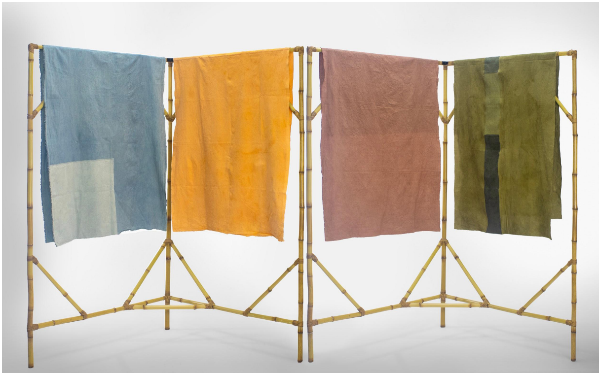
Fig. 1. Bianca Stella, Sementes para uma terra estéril II , 2024. Tingimento natural. Bambu, cipó-imbé e fibras tingidas, 165 x 280 x 80 cm. Curitiba (PR).

Na sequência, apresentaremos os trabalhos artísticos resultantes desse estudo, na forma de relato pessoal, refletindo sobre as implicações poéticas e as experiências com materiais naturais.