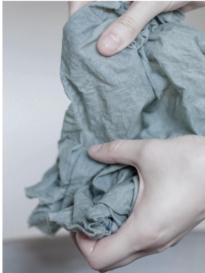
Fig. 2. Bianca Stella, Processos de tingimento natural em ateliê, 2024.

Como trata-se de uma construção artesanal e intuitiva, há, por vezes, variações entre as tonalidades de cores em um mesmo tecido, para além das sobreposições em retalhos. Através dessas nuances, a cor mostra-se viva e cria seu próprio tempo, sendo este corpo, temporização. Estes tecidos tingidos consistem em pinturas, dispostas em pares de matizes complementares contrastantes. Elas estão suspensas em módulos de bambu, amarrados com Cipó-imbé 30 natural da Serra do Mar paranaense. As raízes desta matéria-prima são extraídas, beneficiadas e vendidas por moradores locais da região litorânea, como parte de um ciclo econômico sustentável.