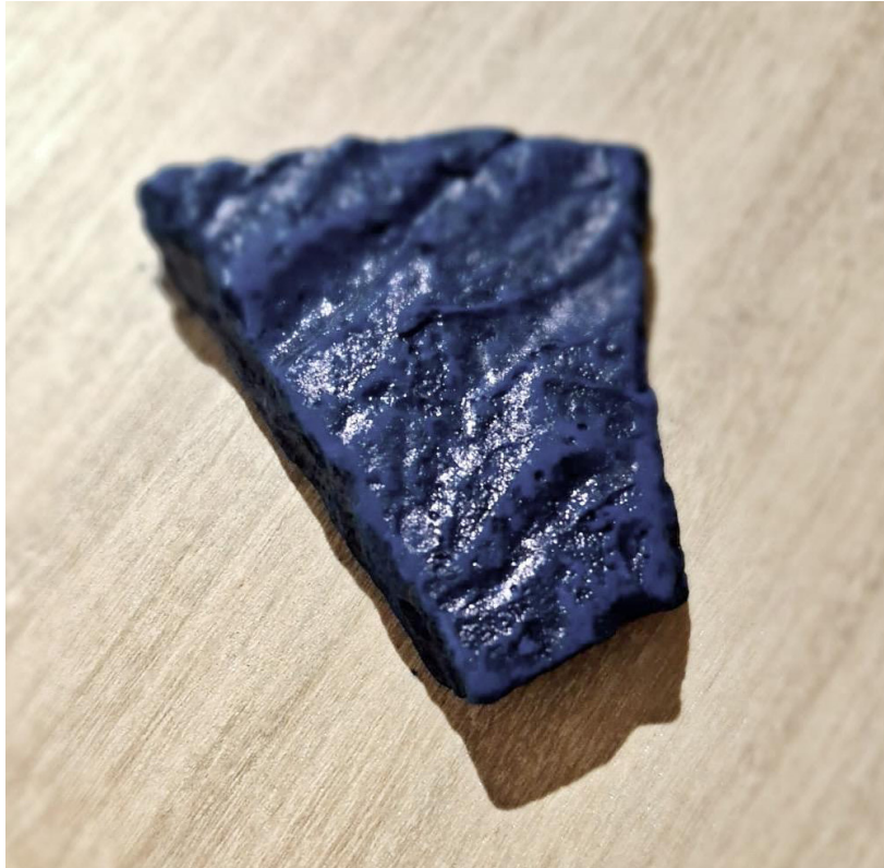
Fig. 4. Taís Cabral, Bloco de pigmento laca de índigo ( Indigofera tinctoria ), 2025. Vitória (ES).

Em outra referência que trago com muita admiração, Alfredo Volpi 41 , em seu trabalho com afrescos e têmperas, mostrou que a cor nunca é fixa. No afresco, dizia, o azul “é mais bonito”, preservado em sua integridade pelo uso da água. Na têmpera de ovo, envolto pelo ligante gorduroso, o mesmo óxido se modifica. O resultado depende do meio: a cor é sempre uma relação entre pigmento, aglutinante, suporte e luz. Assim, o azul atravessa a história como cor em trânsito — entre técnicas, culturas e mercados. É memória, política e prática. No ateliê, permanece como espaço de experimentação, onde cada camada de pigmento carrega histórias locais e globais, ligando matéria, imaginação e mundo.